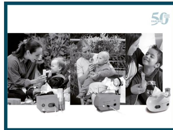
PARI BOY постоянно обновлялась.