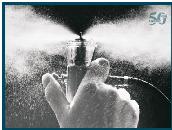
Запатентованное сопло PARI.