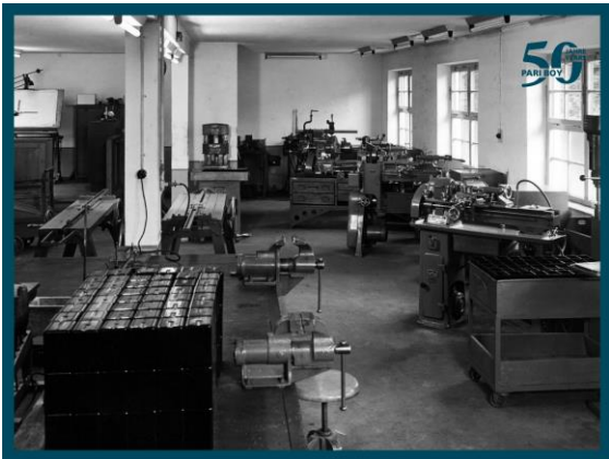
PARI первый производственный цех 1948 Starnberg, Germany