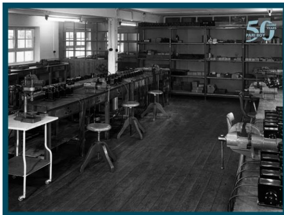
PARI первый производственный цех 1948 Starnberg, Germany